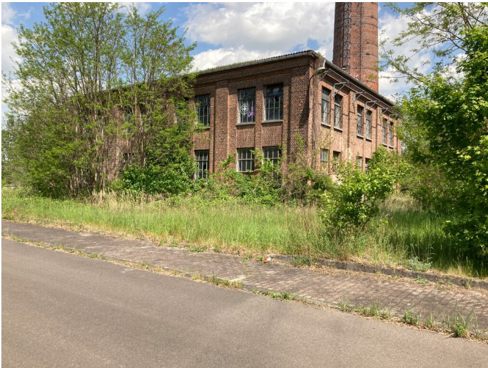
Magazingebäude der ehemaligen Brikettfabrik Neukirchen, Blick von Südwesten.