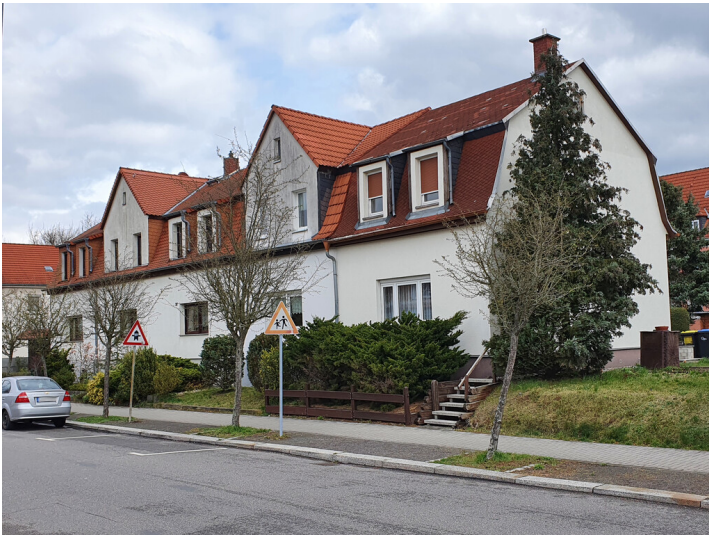
Gruppe bestehend aus fünf Reihenhäusern mit Gärten, Blick von Südwesten.