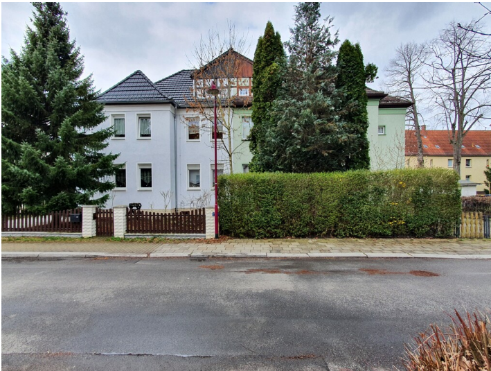
Mehrfamilien-Doppelhaus, Blick von Osten.