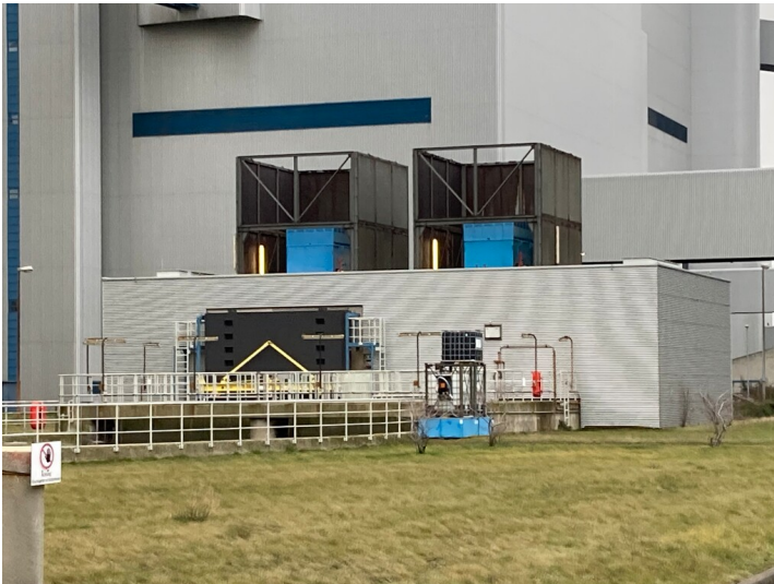
Kraftwerk Boxberg, Kühlwasserpumpenhaus Block Q