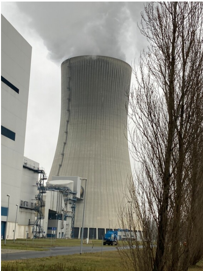
Kraftwerk Boxberg, Kühlturm Block R