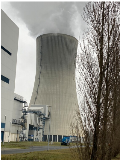
Kraftwerk Boxberg, Kühlturm Block R