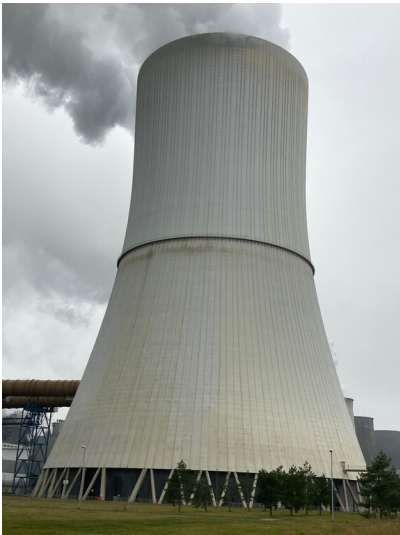
Kraftwerk Boxberg, Kühlturm Block Q