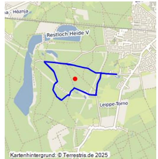
Industriegeschichtlicher Lehrpfad

Der Themenpfad zur frühen industriellen Entwicklung in Johannisthal ist auf einem Rundweg angelegt, der alle interessanten Objekte und Lokalitäten der frühindustriellen Entwicklung einbezieht. Er beginnt an einem früheren Ziegeleilandort mit heutigem Freibad in der Tongrube, führt über einen jüngeren Glassandtagebau, Schloss und ehemalige Glashütte Johannisthal an früheren Tiefbaugruben vorbei, berührt eine weitere Ziegelei und Glassandgrube, um zum Ausgangspunkt zurückzuführen. Auf wissenschaftlicher Basis erarbeitet, erfüllt er eine wichtige Funktion bei der Vermittlung regionaler Geschichte und auch beim Erkennen von menschlichen Einflüssen in der Kulturlandschaft. Der Themenpfad ist bergbau- und industriegeschichtlich von Interesse.