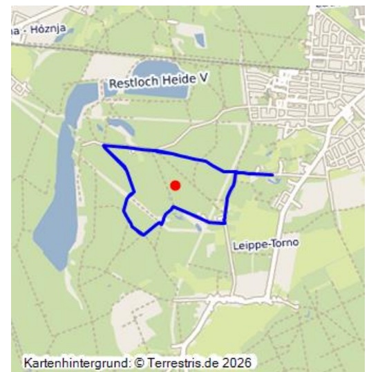
Industriegeschichtlicher Lehrpfad

Der Themenpfad zur frühen industriellen Entwicklung in Johannisthal ist auf einem Rundweg angelegt, der alle interessanten Objekte und Lokalitäten der frühindustriellen Entwicklung einbezieht. Er beginnt an einem früheren Ziegeleilandort mit heutigem Freibad in der Tongrube, führt über einen jüngeren Glassandtagebau, Schloss und ehemalige Glashütte Johannisthal an früheren Tiefbaugruben vorbei, berührt eine weitere Ziegelei und Glassandgrube, um zum Ausgangspunkt zurückzuführen. Auf wissenschaftlicher Basis erarbeitet, erfüllt er eine wichtige Funktion bei der Vermittlung regionaler Geschichte und auch beim Erkennen von menschlichen Einflüssen in der Kulturlandschaft. Der Themenpfad ist bergbau- und industriegeschichtlich von Interesse.