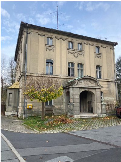
Flachsspinnerei Hirschfelde, Fabrikantenvilla, Ansicht von Osten