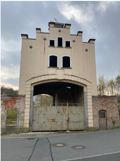
Flachspinnerei Hirschfelde, Portikus, von Westen