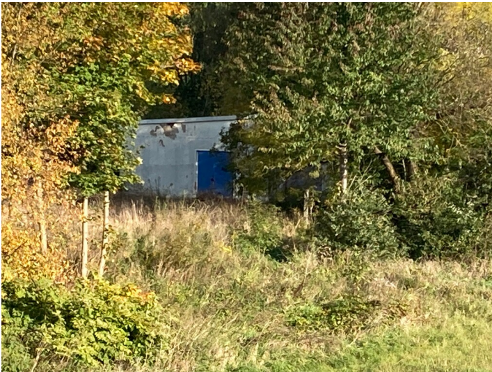
Brauchwasserwerk Neiße für Braunkohlekraftwerk Hagenwerder I, II und III, Ansicht von Südwesten