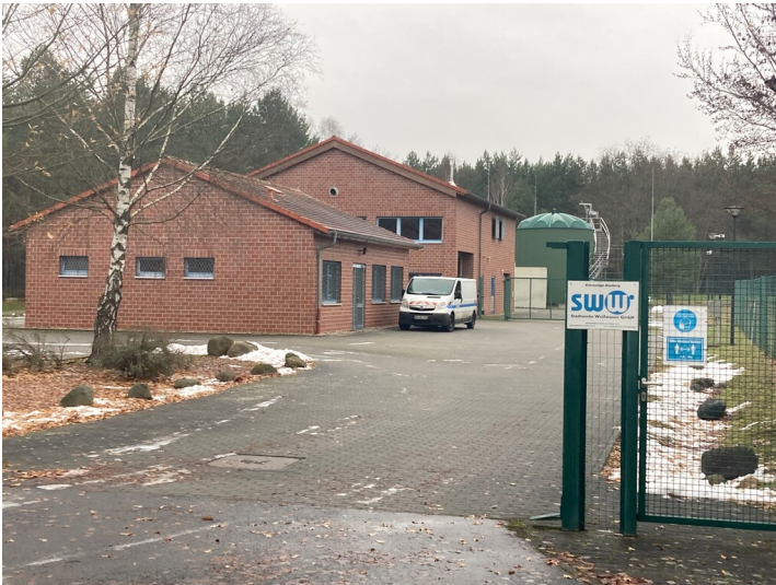
Klärwerk an der B 156