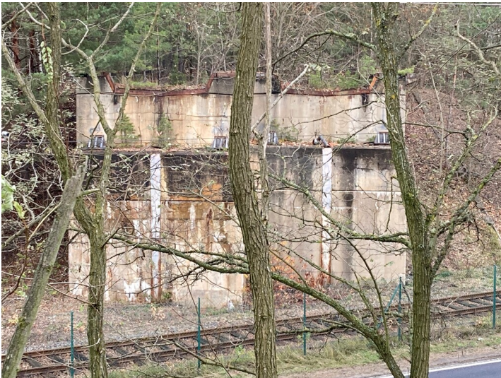
Ehemalige Kohlebahn Tagebau Bärwalde, Brückenwiderlager in der Nähe des Kraftwerkes