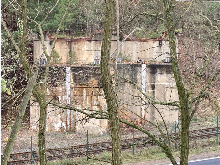
Ehemalige Kohlebahn Tagebau Bärwalde, Brückenwiderlager in der Nähe des Kraftwerkes