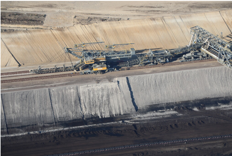
Teil der Objektgruppe Tagebau Reichwalde (30700270), Eimerkettenbagger 1305 Es 3750