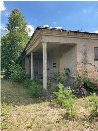
Werksanschluss Braunkohlenwerk Glückauf Knappenrode, Bahnhofsgebäude für den Werksanschluss im Bahnhof Knappenrode