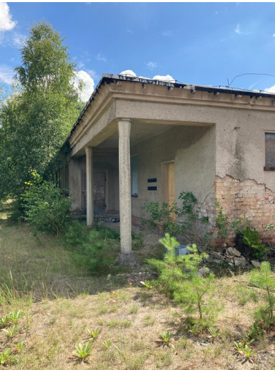
Werksanschluss Braunkohlenwerk Glückauf Knappenrode, Bahnhofsgebäude für den Werksanschluss im Bahnhof Knappenrode