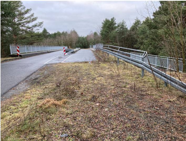
LGB Knappenrode-Lohsa-Boxberg, ehemalige Kohlebahnbrücke über die Bahnstrecke 6579 Königswartha - Weißkollm