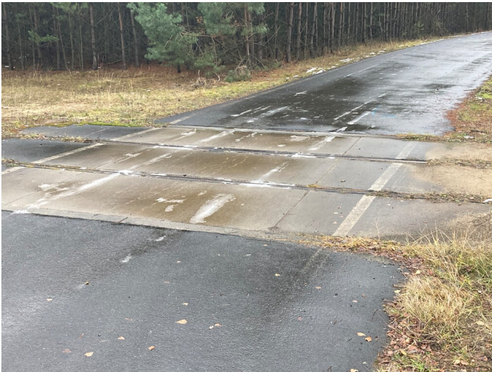
Anschlussbahn Uhyst - Boxberg (zweite, westliche Streckenführung) - Straßenquerung nördlich des Bärwalder Sees