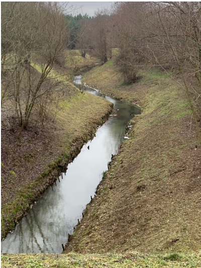
Anschlussbahn Uhyst - Boxberg (erste, östliche Streckenführung) - rechtsseitig des Einlaufes befindet sich die alte Trasse