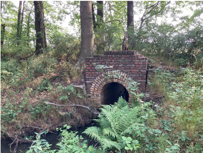
Anschlussbahn Brikettfabrik Skaska, Durchlass im Bereich der Weißiger Teiche