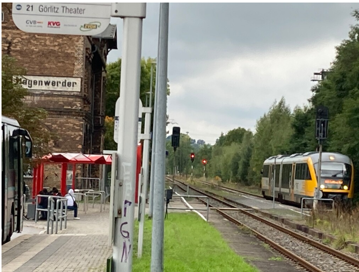
Strecke 6590 Görlitz - Hagenwerder (- Zawidów/Seidenberg), Bahnhof Hagenwerder, Foto Richtung Süden