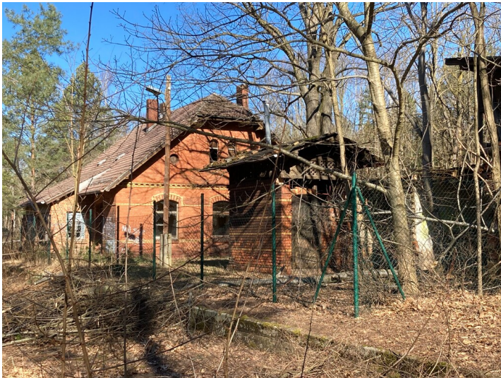
Strecke 6575 Weißwasser - Forst (sächsischer Teil), ehemaliger Bahnhof Halbendorf