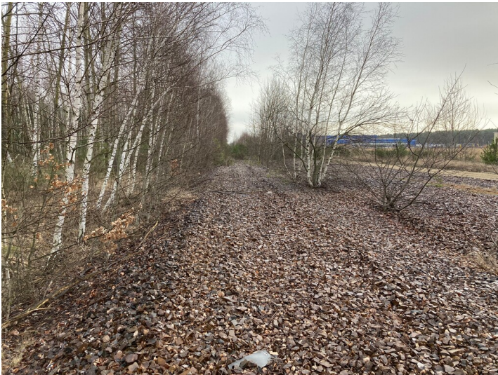
Strecke 6218 Knappenrode - Sornoer Buden West, Bahndamm bei Sabrodt