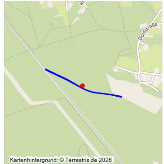
Strecke 6142 Cottbus - Görlitz (sächsischer Teil), Verlegung zwischen Weißwasser und Rietschen für Tagebau Reichwalde, Kartengrundlage OpenRailwayMap 2023

Auf Basis des Braunkohlenplanes für die Entwicklung des Tagebaus Reichwalde ist eine Verlegung der Bahnstrecke 6142 Cottbus - Görlitz zwischen Weißwasser und Rietschen erforderlich. Geplant ist die Verlegung auf etwa 12 Kilometer Streckenlänge mit einer Trassierung parallel zur B 115 sowie der Umbau des Bahnhofs Schleife. Dies ist erforderlich, um die durch die verlängerte Strecke entstehenden längeren Fahrzeiten durch den Bau von zwei Außenbahnsteigen auszugleichen, die gleichzeitige Einfahrten bei Zugkreuzungen ermöglichen. Im Zuge des vorgezogenen Kohleausstieges wurden Anpassungen der Planung im Bereich der Kommandantur des Truppenübungsplatzes Haide vorgenommen. Die Auslegung der Pläne ist 2023 geplant. Überlagert wird das Verfahren durch eine grundsätzliche Bepanung der Strecke im Rahmen der Infrastrukturstärkung der Kohleregionen - es ist ein zweigleisiger Ausbau für höhere Geschwindigkeiten und eine Elektrifizierung vorgesehen.