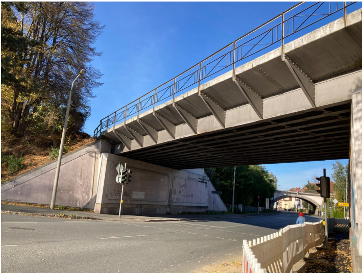
Bahnstrecke Zittau - Liberec, Eisenbahnbrücke über die Schillerstraße