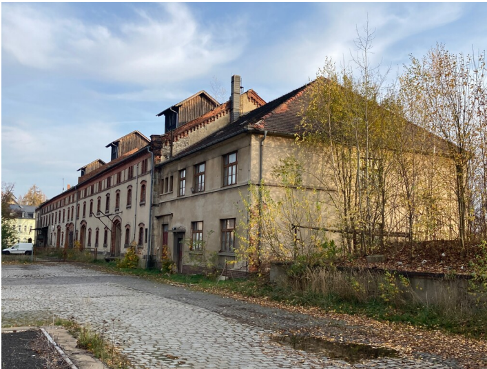
Bahnhof Zittau, östlicher Güterschuppen, Ansicht aus Richtung Westen