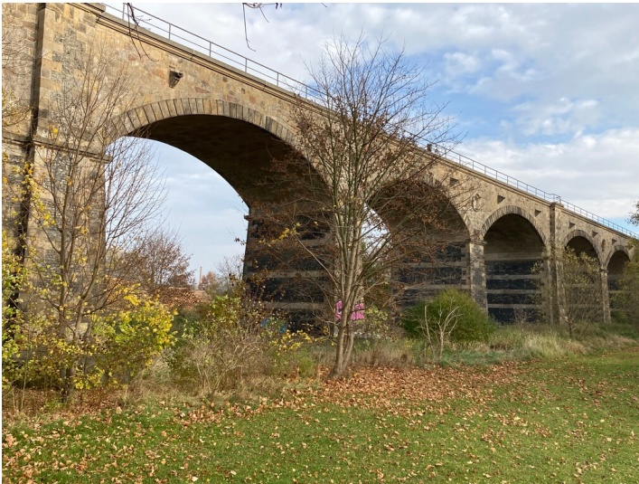
Bahnstrecke Zittau - Liberec, Neißealviadukt, von Südwesten