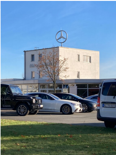
Der höhere Gebäudeteil ist das ehemalige Stellwerk