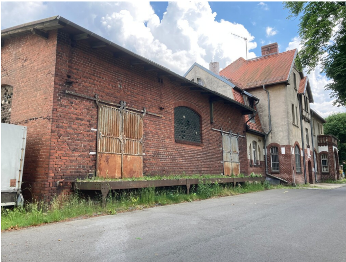
Bahnhof Wiednitz, Ortsseite (West) von Norden