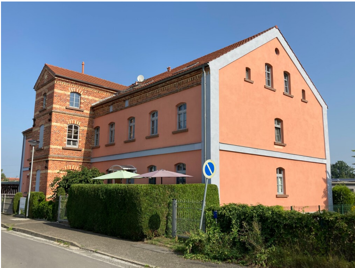
ehemaliges Arbeiterwohnhaus des Glaswerkes Strangfeld & Hannemann, Ansicht von Südosten