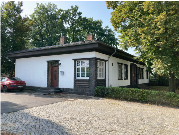
Ehemaliges Hüttenkasino Glaswerk Strangfeld & Hannemann, Ansicht von Norden