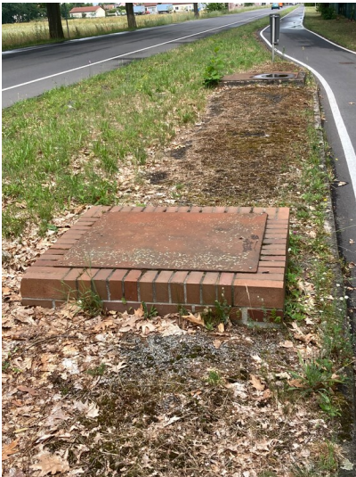
Brauchwasserleitung Knappensee-Zeißig-Kühnicht, Schacht an der Bautzener Straße