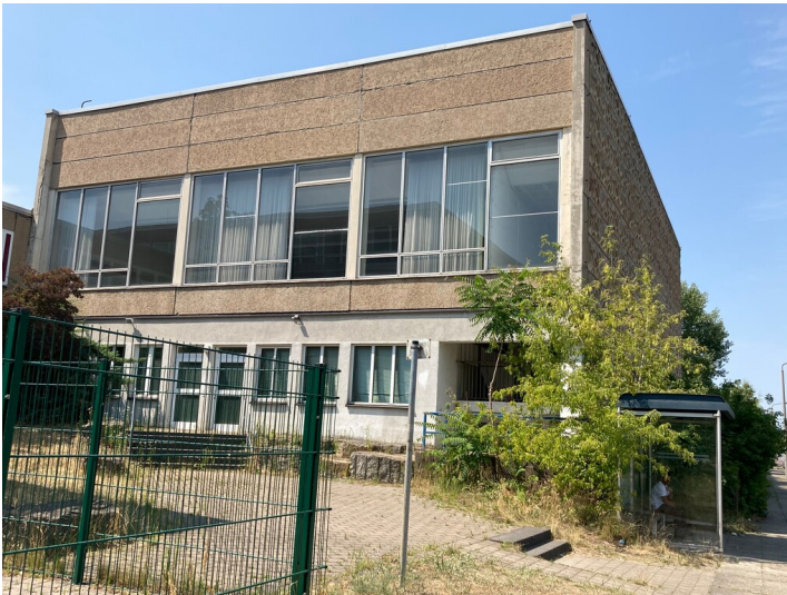
Naturwissenschaftliches Zentrum, Turnhalle, von Süden