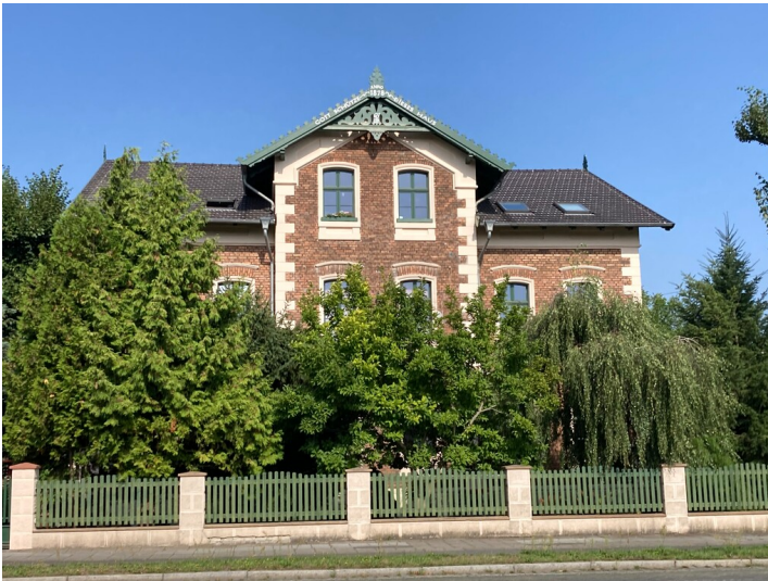
Ehemaliges Reichsbahn-Archiv, Ansicht von Südosten