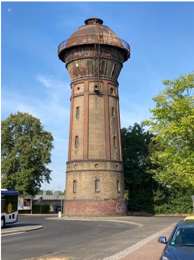
Wasserturm des Bahnbetriebswerkes, Bauart Klönne, Ansicht von Osten