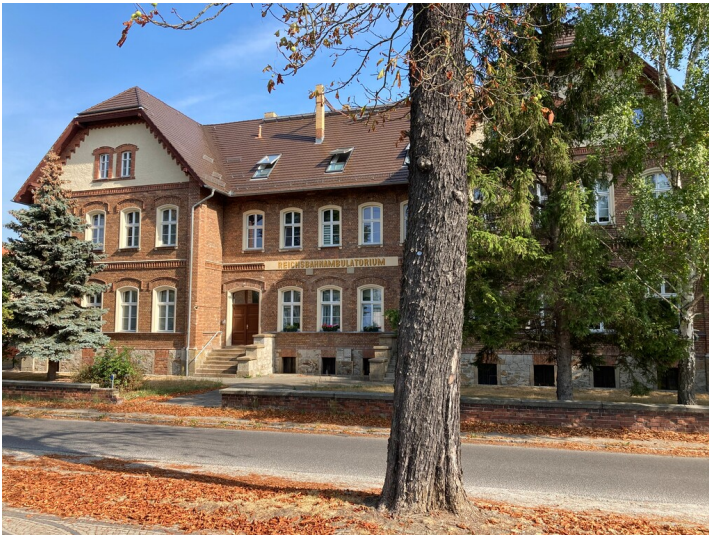
Ehemaliges Reichsbahn-Ambulatorium, Hauptansicht von Süden