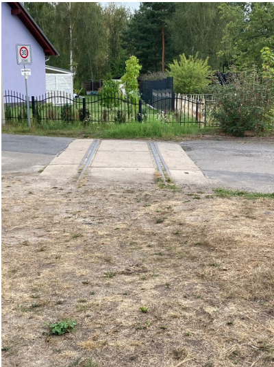
Ehemaliges Dachziegelwerk und Ziegelei, Ziegeleigebäude z. T. aus den 1970er Jahren, früherer Gleisanschluss