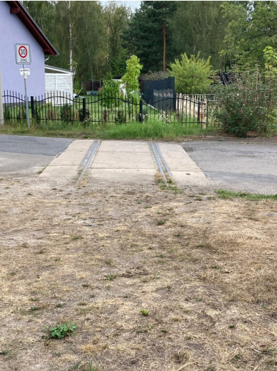
Ehemaliges Dachziegelwerk und Ziegelei, Ziegeleigebäude z. T. aus den 1970er Jahren, früherer Gleisanschluss