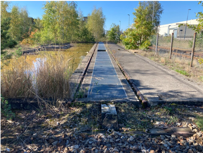
Ehemaliges Slopsystem zur Erfassung verbrauchter Industrieöle, von Osten gesehen