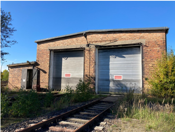
Lokschuppen der Werkbahn, Ansicht von Osten