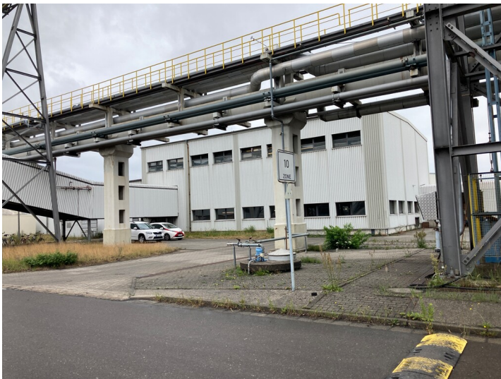
Palettierhalle 10 kg, von Südwesten gesehen