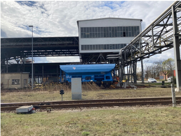
Brikettfabrik - ein Windenhaus links im Bild