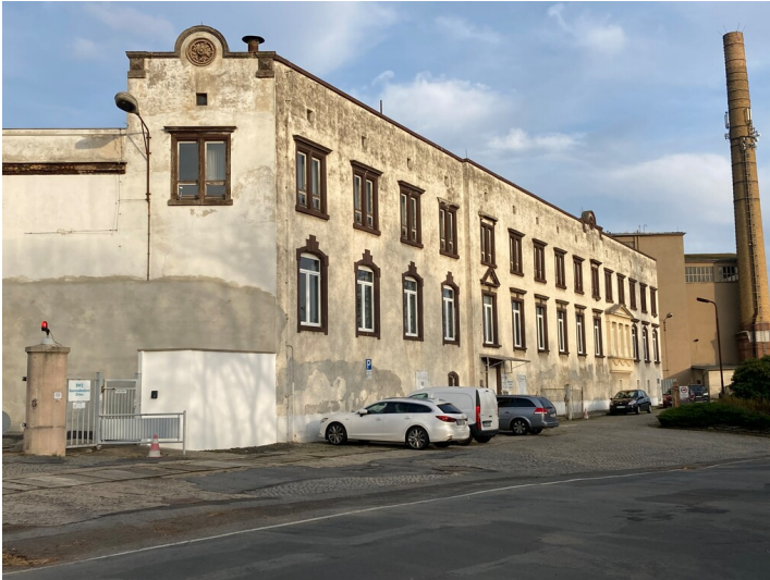
Baumwollweberei Zittau