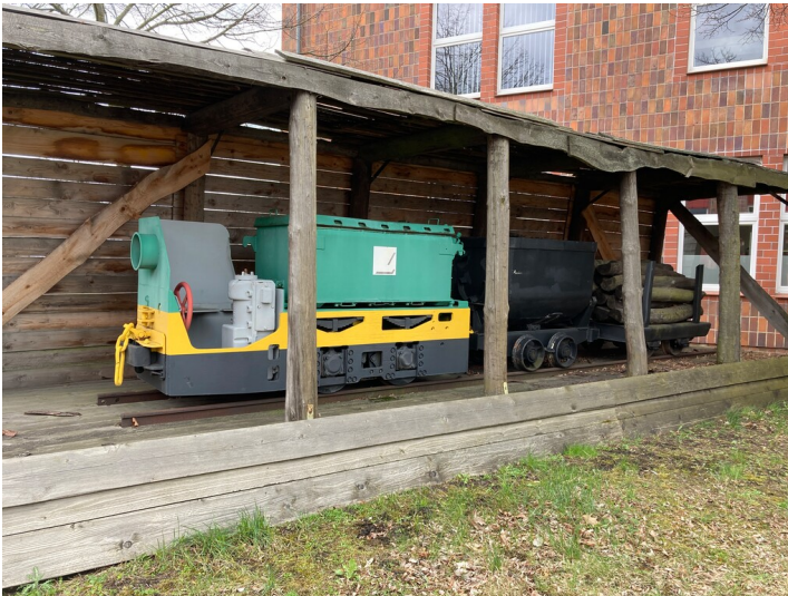
Grubenbahnzug vor der Gasrettungsstelle