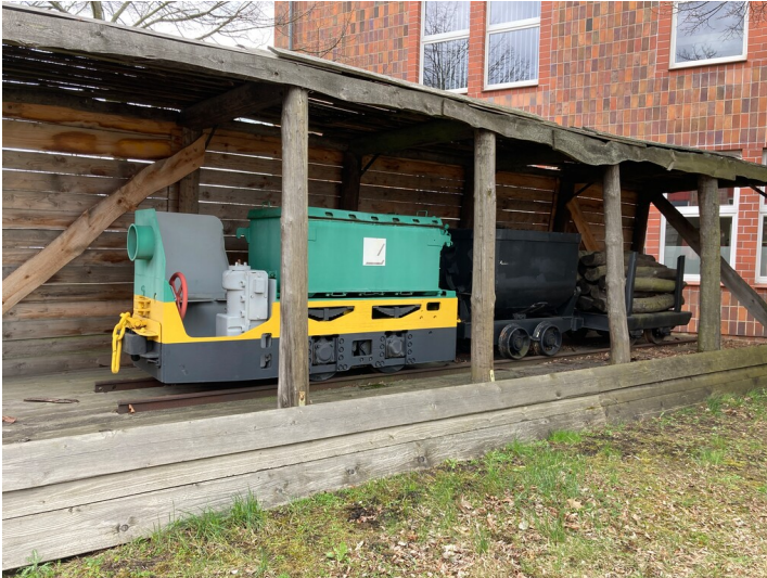
Grubenbahnzug vor der Gasrettungsstelle