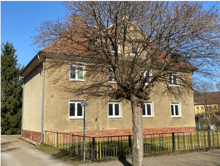
Kolonie Erika, 2 Mehrfamilienwohnhäuser Parkstraße 11 und 13, Ansicht von Osten