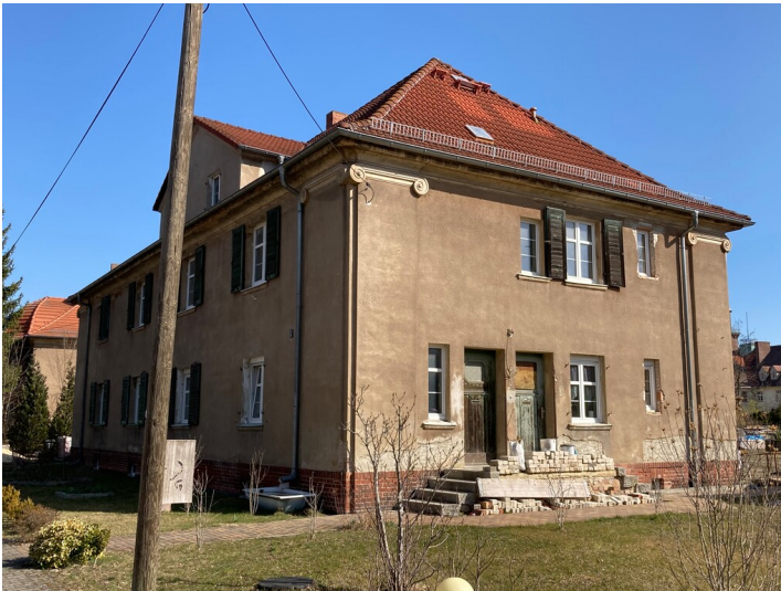
Kolonie Erika, Mehrfamilienwohnhaus Parkstraße 7, Ansicht von Südwesten