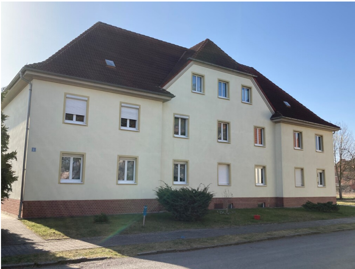
Kolonie Erika, Mehrfamilienwohnhaus Parkstraße 1, Ansicht von Nordwesten