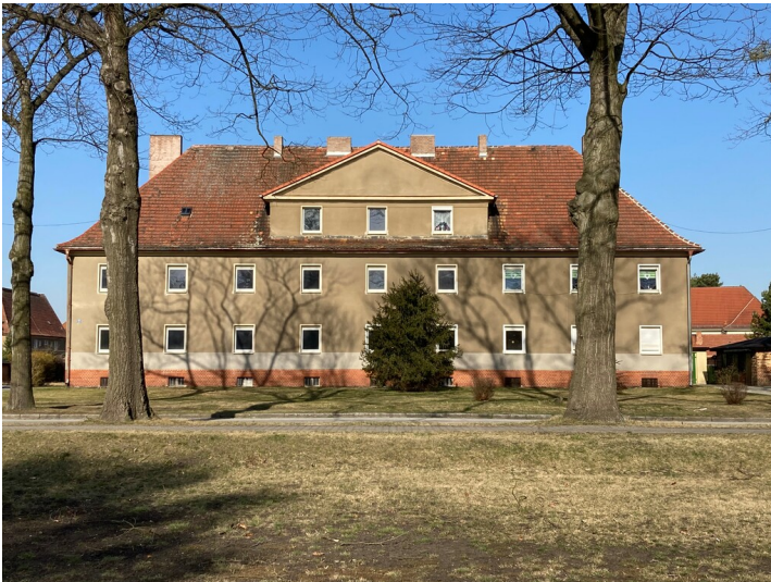
Kolonie Erika, Mehrfamilienwohnhaus Hauptstraße 7, Ostansicht