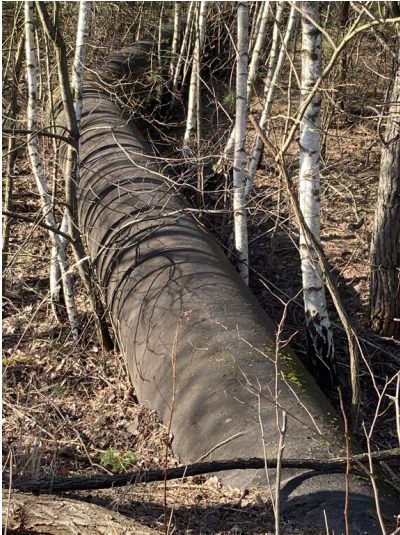
Abwasser-Pumpleitung ca. DN800, oberirdisch verlegt, industriegeschichtlich von Interesse