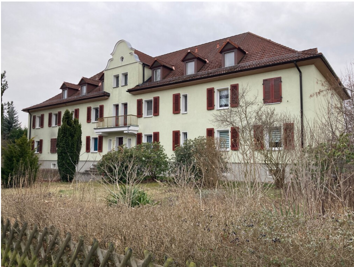
Drei Gemeinschaftshäuser, als Wohnheime für ledige Arbeiter des Lautawerkes errichtet