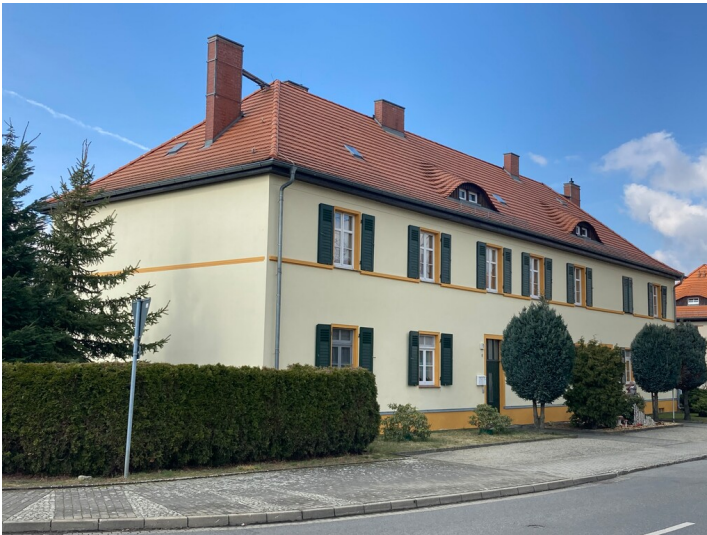
Zweigeschossiges Mehrfamilienwohnhaus Parkstraße 1 und 1a, von Südosten gesehen