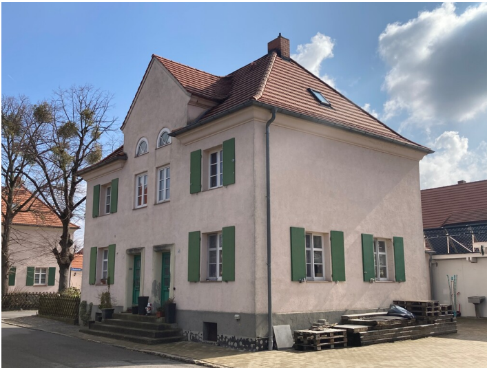
Zwei Doppelwohnhäuser, Ansicht von Nordwesten