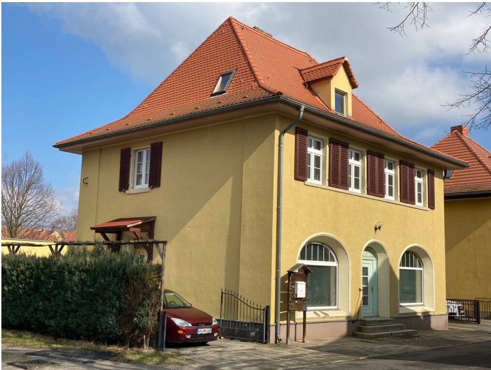
Wohn- und Geschäftshäuser des 2. Bauabschnittes, Straßenfassade, Blick von Süden